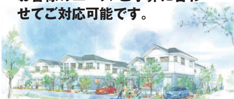
※イメージバースにつき、実際の形状とは異なる場合がございます。

G・F区画はフリープランです。 お客様のニーズ・ご予算に合わせてご対応可能です。